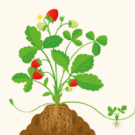
Formation des fruits